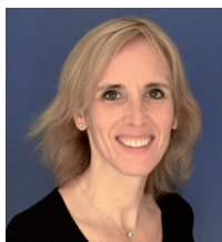
Anne-Laure ZIMMERMANN Inspectrice de l'Éducation Nationale