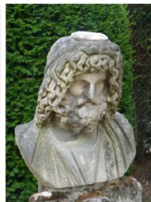
© Fragment du Palais des Tuileries