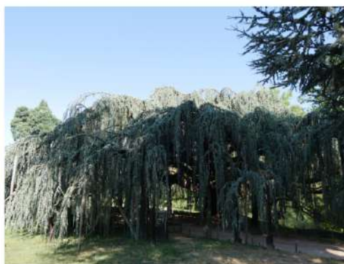
© Le Cèdre Bleu Pleureur de l'Atlas - Arboretum